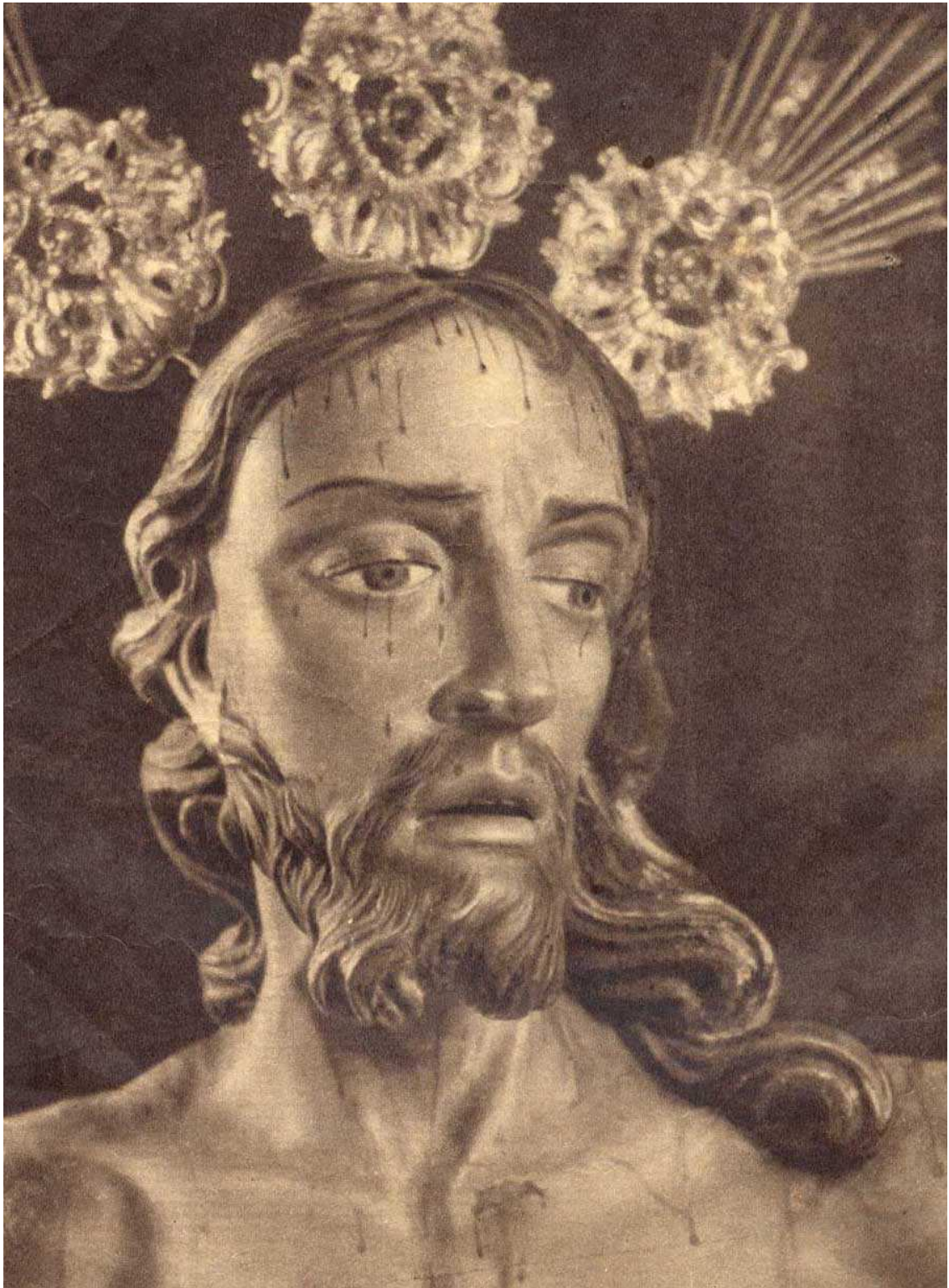
Foto que acompañaba al artículo de Rodrigo de Molina, titulado “Jácome Baccaro”, en el ABC de Sevilla del Domingo de Ramos, 25 de marzo de 1956.