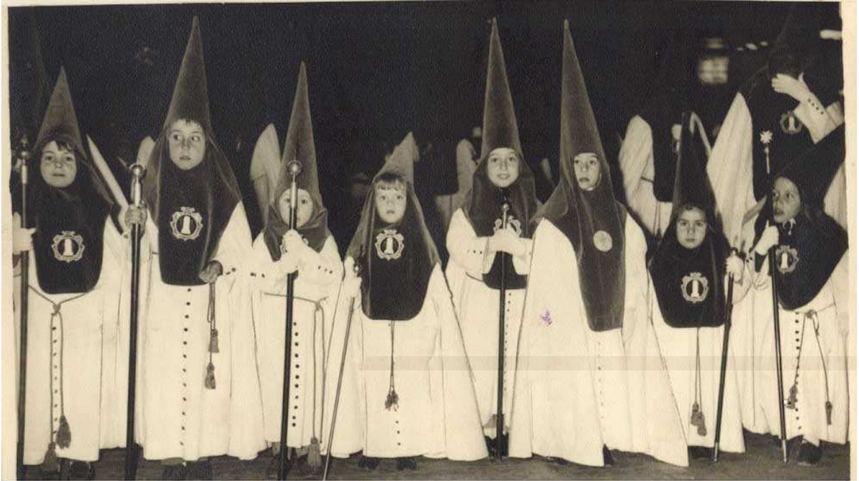
Grupo infantil, 22 de marzo de 1967.